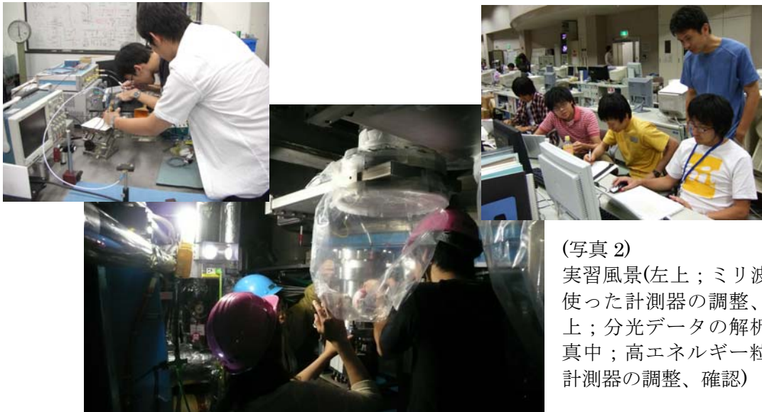
(写真 2) 実習風景(左上；ミリ波を使った計測器の調整、右上；分光データの解析、真中；高エネルギー粒子計測器の調整、確認)