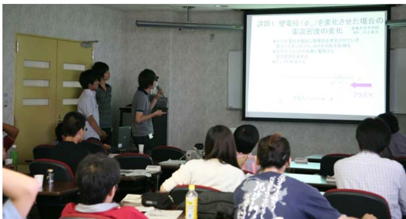
(写真 3) 成果発表会の様子(研究グループ毎に発表)

体験入学の期間中には、上記の研究体験、研究発表以外にもいくつかの催しが行われました。そのひとつは、核融合研の主研究施設である大型ヘリカル装置とスーパーコンピュータ、バーチャルリアリティ(3次元グラフィックによる仮想現実化)装置の見学です。この施設見学は体験入学の初日に行われ、この見学により、最先端の研究施設の一端にまず触れることになります。さらに今回は、専攻長である本島 修 核融合研究所所長による特別講義も行われ、核融合研究の魅力について学ぶ機会が得られたと思います。また、2日目の夕方に夕食を兼ねた懇親会が開かれました。懇親会では、研究を行う上での喜びや悩み、研究以外の楽しみ等についても話し合わせ、体験学生と指導教員、実習補助を行う総研大在学生の間の親睦が深まったようでした。さらに、体験期間中は規則正しい生活リズムを持ってもらうため、毎朝朝礼の時間をとり「体験入学生」が一同に会する機会を設けました。朝礼では「体験入学生」に一人 2-3 分で自己紹介や体験課題の感想を話してもらいましたが、研究テーマが異なる「体験入学生」同士の相互理解が深める良い機会になったようです。