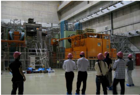
(写真 4) 大型ヘリカル実験装置の見学