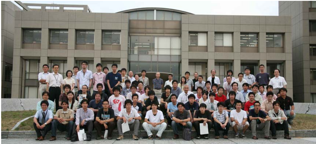
(写真1) 本島専攻長を中心に体験入学生、担当教員、在学生の集合写真

物理科学研究科・核融合科学専攻では、核融合科学専攻の研究内容に興味を持つ学生の発掘と核融合科学の研究内容の周知を目的として、毎年8月に「夏の体験入学」を開催しています。本年は2008年8月4日(月)から8月8日(金)に、第5回が開催されました。参加対象は、大学1-4年生、大学院博士前期課程(修士課程)学生、高専4-5年生・専攻科学生で、今回は31名の学生が全国各地(北は北海道から南は福岡県)から体験入学に参加しました。