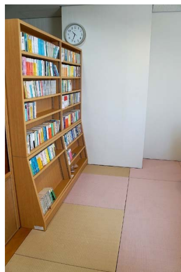
最近の発見：図書館棟 畳コーナー

○広報社会連携室では、総研大の研究成果をメディアを通じて広く社会に発信しています。特に、総研大在学生在が筆頭著者として研究論文を出版する際、プレスリリースを行う場合は、総研大と所属専攻 (基盤機関) との共同プレスリリースを行っておりますので、是非総研大広報社会連携室までご連絡ください。