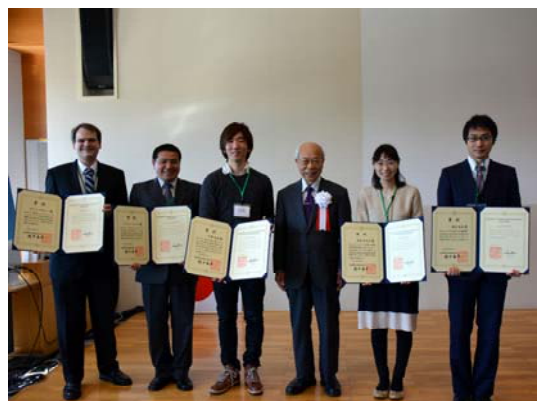
学長と長倉研究奨励賞・総研大研究賞の受賞者