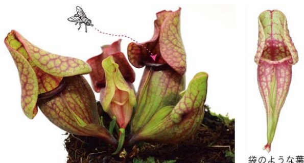
図 1 サラセニア Sarracenia purpurea の袋のような葉

サラセニアは、北米原産で袋のような葉を作り、その中に消化液を溜め、落ちた小動物を食べてしまいます（図 1）。