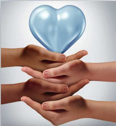
ヒトはなぜ協力するか? — 間接互恵性からのアプローチ —