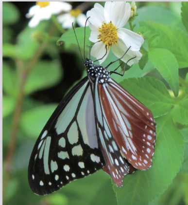
旅をする虫たち — その方向を知る仕組み —