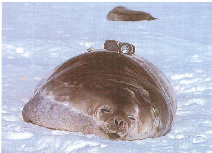
ウエッデルアザラシ 背中にデジタルカメラをつけている。

これまでの表層生態系の理解は次のようであった。「ナンキョクオキアミは植物プランクトンに依存するため光が届く浅い層、いわゆる有光層に出現する。ペンギン、アザラシ、クジラなどの捕食動物は、この層に潜水して、これらのオキアミやオキアミを捕食する魚類やイカなどを食べている」。しかし、1980年代末から1990年代はじめに行われたアザラシ類の潜水行動研究では、ゾウアザラシが有光層よりはるかに深く、1000mを超えて潜水することがわかり、ウェッデル