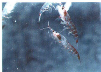
ナンキョクオキアミ