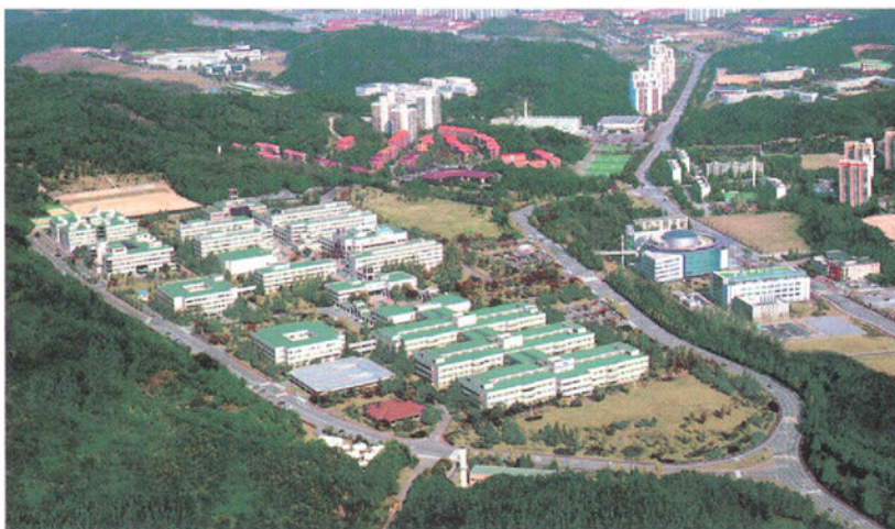
浦項工科大学校の全景