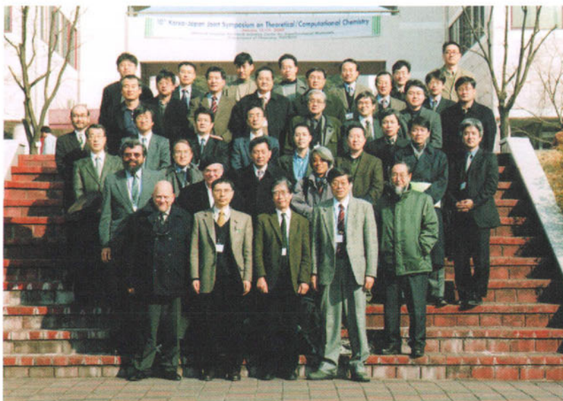
浦項工科大学校での第10回日韓合同シンポジウム

韓国の分子科学の進展には目覚ましい ものがあり、日韓の密な研究交流はアジ アばかりでなく、世界をリードする分子科 学研究の発信元になることが期待される。