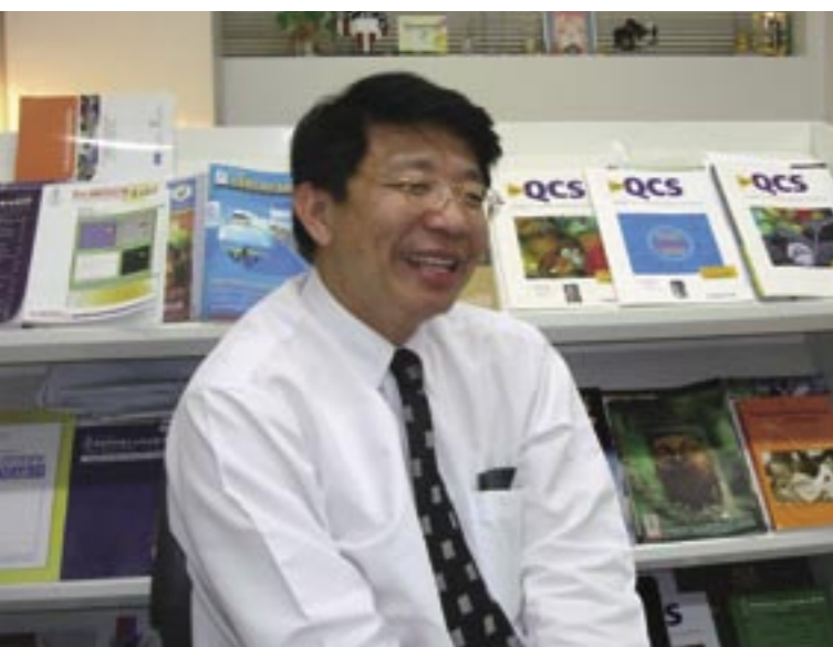
チュラロンコン大学薬学部助教授のワンチャイ氏。大学ランキングの発案者の1人。

「基礎研究と応用研究をつなぐには、グローバルな連携が必要です。例えば私の専門はマラリア原虫の薬剤耐性機構の解明で、きわめて基礎的な研究です。この成果を抗マラリア薬の開発につなげようとすると、前臨床研究や動物実験が不可欠になりますが、この段階の研究はタイ国内ではできません。オーストラリアや英国と提携することで、薬剤開発を実現していこうとしています。いずれはタイ国内ですべての研究ができるようにしたいですが、現時点では基礎と応用をグローバルな視点でつなぐことが重要でしょう」と、現場への深い理解を示す。