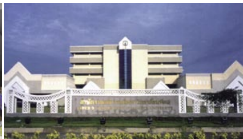
マヒドン大学 もともとは医学校として1898年にバンコクに設立。1969年にマヒドン大学と名称を変え総合大学となる。2005年11月現在、1万4604人の学生が在籍。学科数も551と多い。