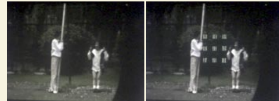
ノイズのない映像

今後は、映画用スクリーンだけでなく、液晶ディスプレイやLEDディスプレイにもこの技術が適用できないか検討していく予定である。