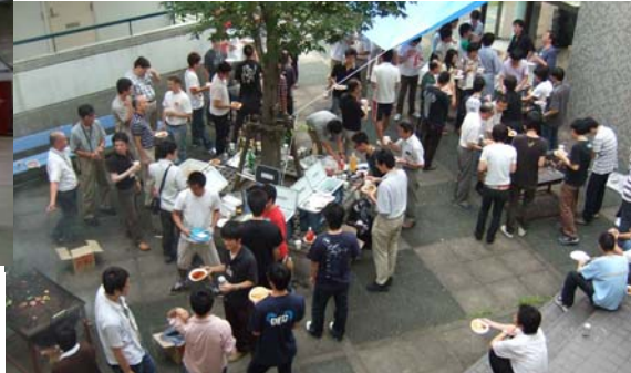
(写真 5) 懇親会の様子(今年は宿泊施設の中庭で バーベキュー)