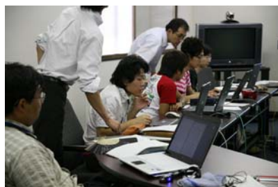
写真4 シミュレーションの様子