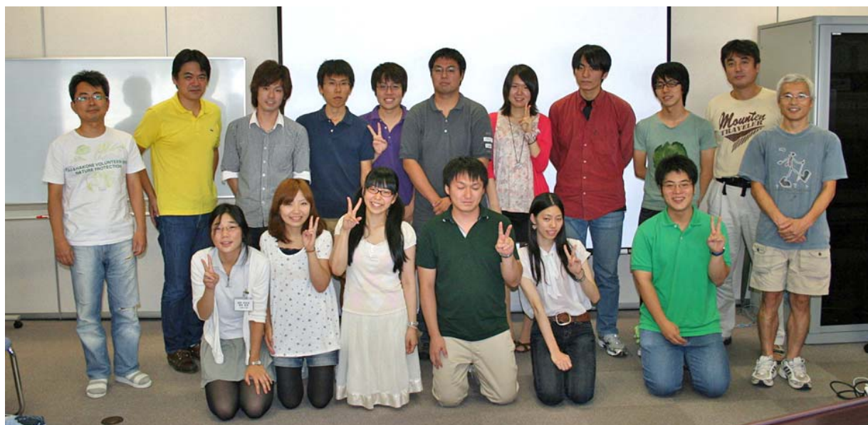
【文責 遺伝学専攻 准教授 野々村賢一】

彼らが将来研究者を志し、その志を果たす出発点として総研大を（願わくば遺伝学専攻を）選択してくれることを心より願っています。