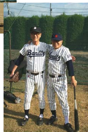
30年前のユニフォーム (筑波大学学術情報処理 センター時代)

◎各専攻で教員や学生がメディアに出演が決まっている場合や、発表や表彰等があった際にはご連絡ください。またメディア等に出演される場合は、可能な限り「総合研究大学院大学」と表記していただけますようご協力をお願いします。