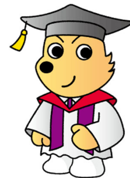
情報犬 ビットくん