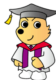
情報犬 ビットくん