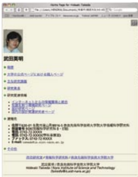
筆者の1996年ごろのWWWページ。もっと前から個人ページをつくっていたが、保存されていなかった。これはInternet Archive ( http://www.archive.org/ )で最古のものを探してきた。

考えてみると不思議なことである。単に情報交換のためならば、詳細な自己紹介など要らない。データや論文だけで十分なはずである。にもかかわらず、多くの研究者が慣れないHTMLをテキストエディタで一所懸命に