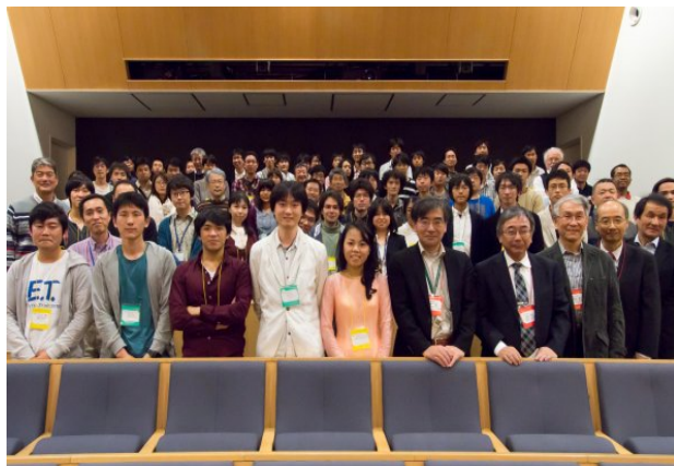
【高エネルギー加速器研究科】